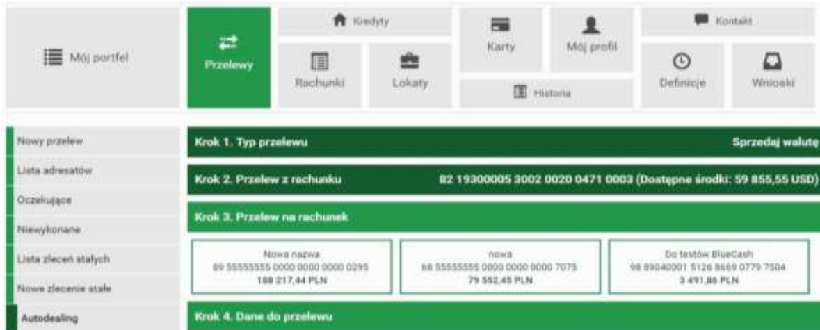
Rysunek 4.59: Krok 3. - Autodealing - Przelew na rachunek